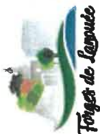
TABLEAU RECAPITULATIF DES INDEMNITES DES ELUS MUNICIPAUX