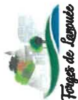
TABLEAU RECAPITULATIF DES COMMISSIONS COMMUNALES THEMATIQUES FACULTATIVES